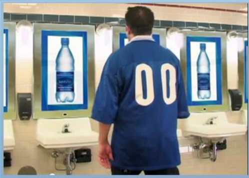
원거리 ( 광고 콘텐츠 표출)

스마트미러에 거리감지센서(근접센서)를 부착하여, 평소에는 광고 등의 콘텐츠가 표출이 되며, 고객 근접시 일반 거울로 전환