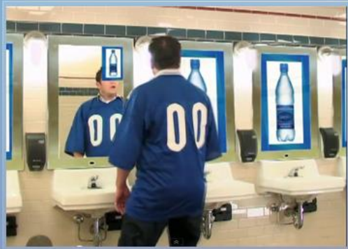
근거리 (광고축소 및 일반 거울로 전환)